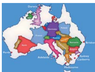
Un pays de la taille de l'Europe.

Les biens de consommation, vins et spiritueux, équipe-