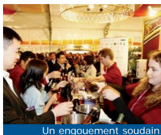
Un engouement soudain.

Pourquoi cet engouement ? Les vins sont le symbole d'un art de vivre et d'une occidentalisation prisés par les habitants qui élèvent leur niveau de vie. Il y a aussi la fin de taxes à l'importation. À Hong Kong, par exemple, les autorités estiment préférable de