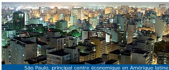
São Paulo, principal centre économique en Amérique latine.

Numéro un mondial des dispositifs de régulation thermostatique, Vernet ne peut assurer sa croissance que par l'acquisition de nouveaux clients. L'utilisation de la robinetterie thermostatique est en général liée à un accroissement du besoin de confort et à une évolution de la demande pour des raisons législatives ou écologiques. Ces demandes sont fortement liées à l'élévation du niveau de vie. C'est donc plus particulièrement dans les pays émergents que les potentiels sont à rechercher. Pour Vernet, l'ampleur de la