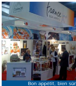
Bon appétit, bien sûr.